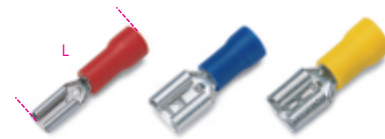
1622R/2,8K 0,5+1,5 mm 2