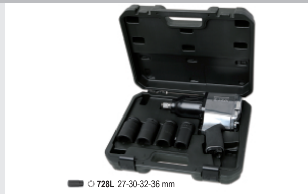
728L 27-30-32-36 mm